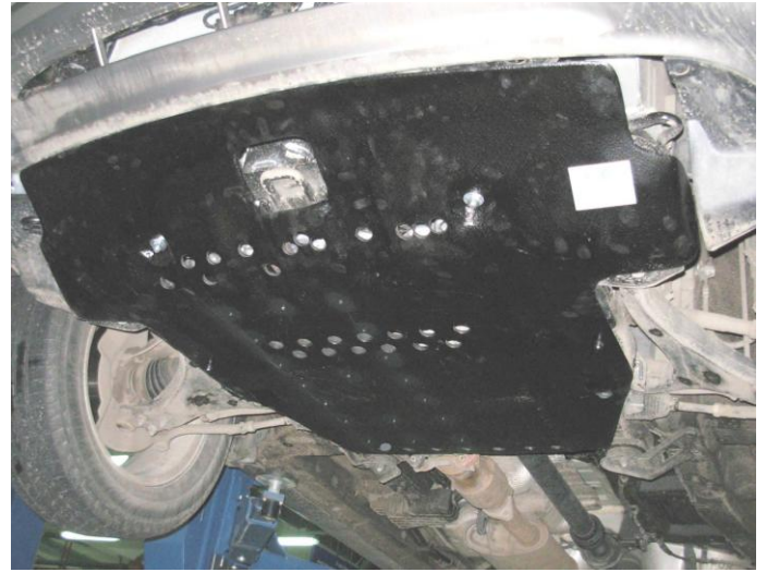
Защита на автомобиле.