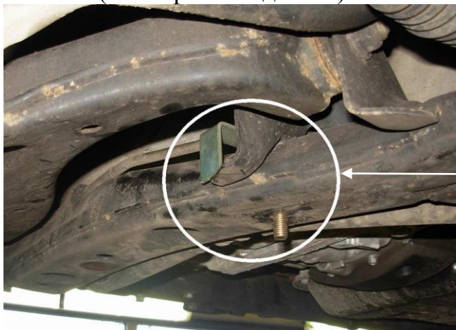
Заднее левое крепление защиты (со стороны водителя).