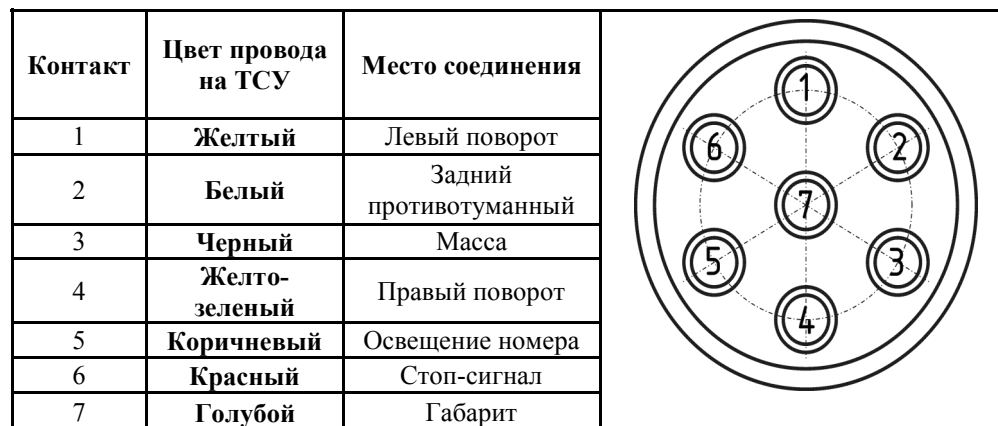
СХЕМА МОНТАЖА ТСУ